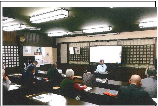
【奥州市観光サポーターフォローアップセミナー（10/30・11/6）】