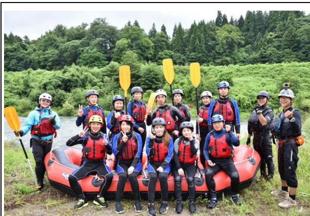
【ラフティングインストラクター育成支援研修会（7/29）】