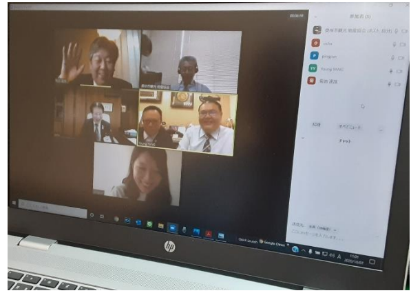
【奥州台湾観光親善アンバサダー 意見交換会 (10/7)】