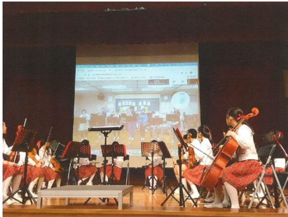
【真城小学校・福星国民小学 オンライン音楽交流会 (3/9)】