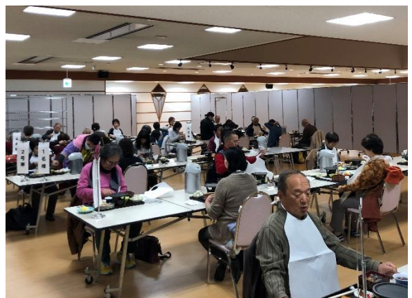
【仙台圏日帰りモニターツアー (10/24)】 (えさし藤原の郷紅葉ライトアップほか)